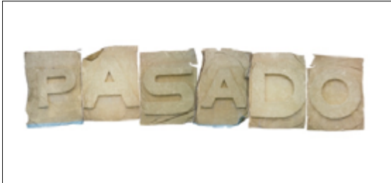
Figura 9. Pasado [Transferencia polaroid y acrílico], Saulo Blanco García

El muro amarillo tiene inscrito el nombre del expresidente Adolfo López Mateos, yo retomo las letras de esas palabras para realizar anagramas para explorar nuevas interpretaciones entorno al discurso modernista.