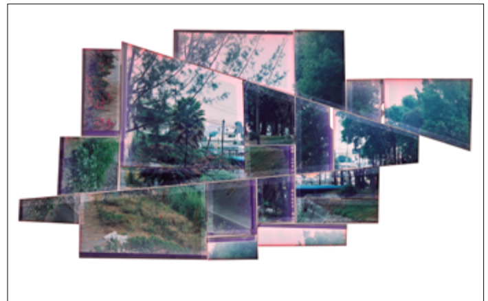
Figura 3. Puente de Garzas , [Fotografía, Duratrans y caja de luz]. Saulo Blanco García

Hay aspectos que aun sigo estudiando como el problema de la movilidad dentro de las propias ciudades, por ejemplo, los conceptos de ciudad dormitorio o movimiento pendular, siguen siendo líneas de investigación pendientes. En este sentido y de forma orgánica a lo largo de esta investiga-