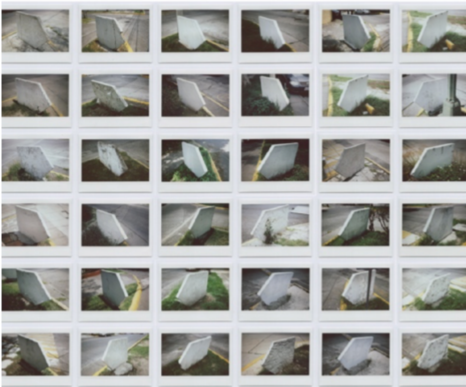
Figura 10. Lápidas [Fotografía instantánea], Saulo Blanco García

Las señalizaciones en forma de flecha las fotografió por la parte de atrás, cancelo su función primaria descontextualizando el lugar donde se encuentran, centro la atención en la forma; para mi es una forma de ver el lado opuesto de la historia, el cual solo es posible caminando por ciudad satélite. Las repeticiones de estas formas me siguieren ser lápidas de alguna promesa olvidada de un algún lugar extraño y ajeno para mí.