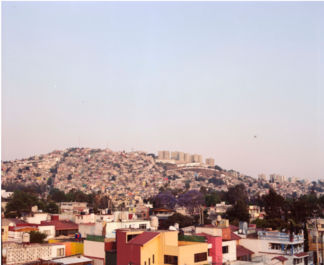
Figura 1. Mirando hacia afuera [Fotografía análoga], Saulo Blanco García

El término arrabal fue introducido por los españoles a su llegada a territorio mesoamericano en el siglo XVI, su origen etimológico tiene raíces árabes e hispánicas, los españoles lo usarían solo para describir diferentes lugares, sin ninguna referencia a la pobreza o miseria. Estos territorios tuvieron esta connotación negativa solo hasta el siglo XIX, para designar las barriadas indias (Zamorano, 2007), y de ahí en adelante se usarían para definir lugares donde reinaba el crimen y la marginalidad, es decir lugares fuera de la ley.