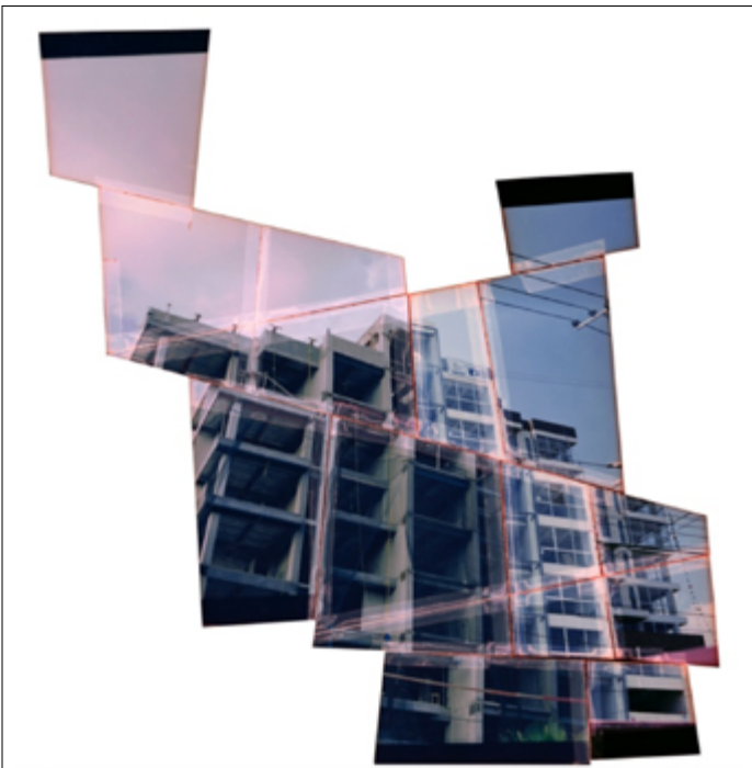
Figura 2. Desarrollo inmobiliario , [Fotografía, Duratrans y caja de luz]. Saulo Blanco García

Como mencionamos anteriormente muchos de los lugares que normalmente se asociaban a la clase trabajadora y con menos recursos económicos poco a poco fueron transformados en lugares planificados para clases sociales con mayores ingresos económicos, a pesar de esto los residentes originales nunca fueron totalmente desplazados, y la condición homogénea de estos lugares se transformó a una heterogénea, donde muchas clases sociales conviven en un mismo espacio, por lo que se dificulta la clasificación de estos territorios, y no podemos asumir que exista una periferia absoluta donde solo exista pobreza y marginación, ya que es muy común encontrar lugares con fuertes contrastes económicos y sociales.