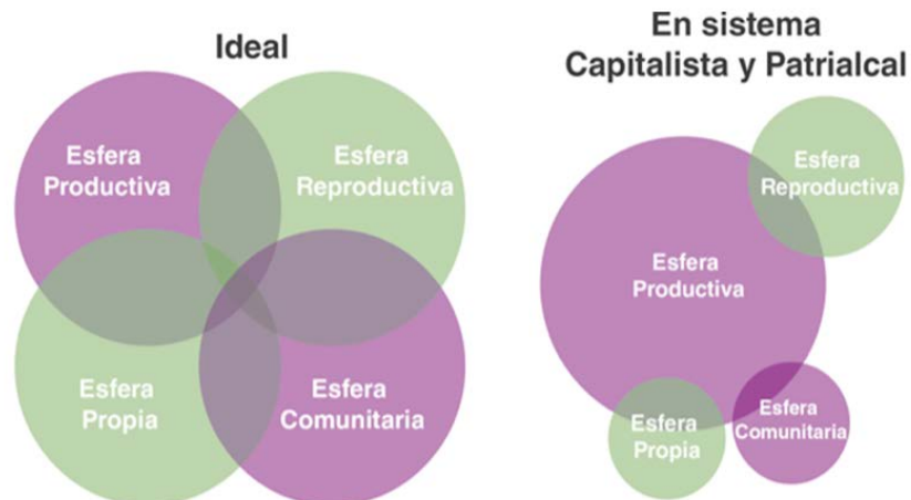
Figura 1. Esferas.

Nota. División de Esferas de acuerdo con Adriana Ciocoletto y Col.lectiu Punt 6, basadas en Hannah Arent. Tomado de Urbanas MX, & Rivera, C. (2020, septiembre 24). La triple jornada invisibilizada. Madres profesionistas en tiempos de pandemia. Experiencia CDMX. Medium. https://mxurbanas.medium.com/la-triple-jornada-invisibilizada-madres-profesionistas-en-tiempos-de-pandemia-experiencia-cdmx-b939dd934756