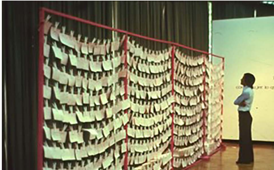
Figura 2. Tendedero.

plática, esto por la disposición de espacios de lavado en áreas comunes en algunas unidades habitacionales; de aquí el “tender” juntas y exponer, en este caso, agresiones y acoso sexual, generar fuerza y contención entre cualquier persona que desee exponer su caso, siendo participe de la misma obra colectiva (Figura 2).