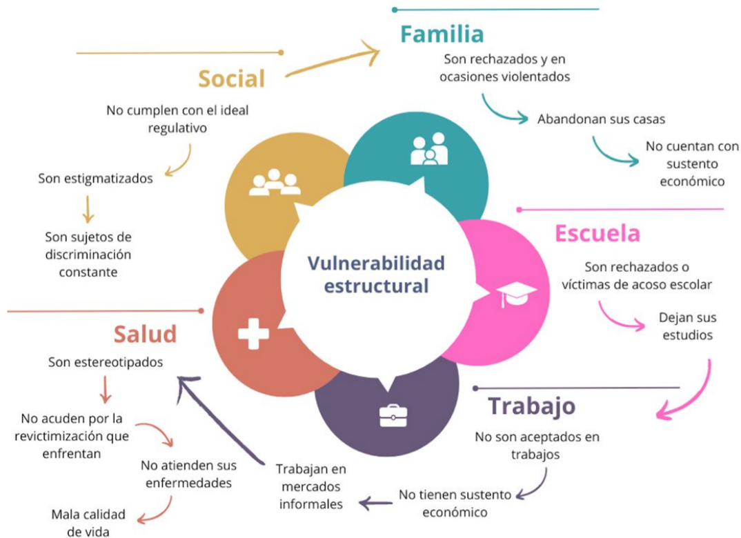
Figura 5 Diagrama de elementos de la discriminación sistémica que viven las personas transexuales