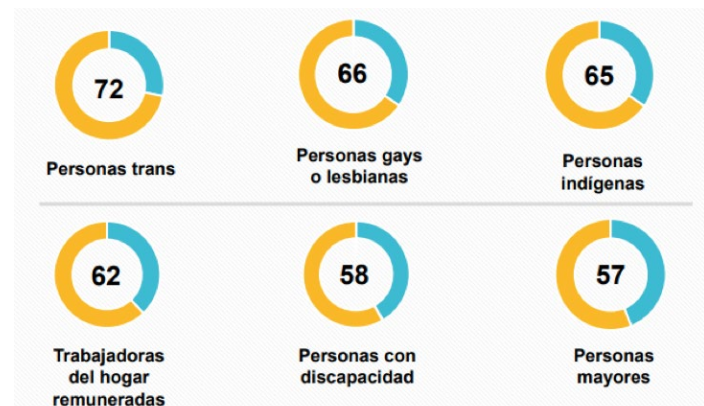
Imagen 1. Resultados de la Encuesta Nacional sobre Discriminación 2017, muestran los porcentajes de percepción de exclusión por grupos

En la Encuesta Nacional sobre Discriminación, realizada en el 2017 en México, los resultados sobre los grupos vulnerados y excluidos, muestran los porcentajes en que cada grupo se ha visto excluido: un 72% de las personas trans, un 66% de las personas gays, un 65 % de las personas indígenas, un 62% de las trabajadoras del hogar remuneradas, un 58% de las personas con discapacidad y un 57 % de los adultos mayores.