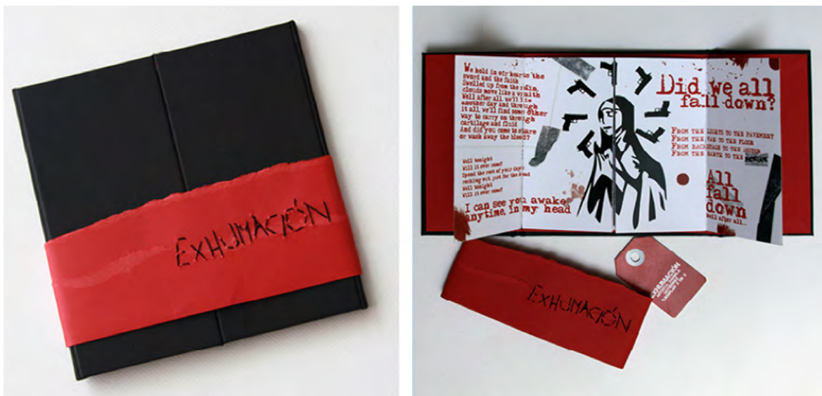
Figuras 8 y 9. Libro-arte Exhumación. A través de una selección musical cuyas letras expresan los estados de ánimo de la autora, se plasmaron a través del texto visual y verbal sentimientos de angustia, soledad, pérdida del sentido de la vida y depresión.