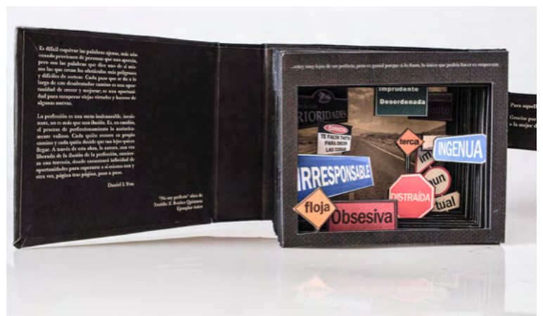
Figuras 1 y 2. Libro-arte No soy perfecta. Fragmento del texto de presentación: “La perfección es una meta inalcanzable, inexistente, no es más que una ilusión. Es, en cambio, el proceso de perfeccionamiento lo auténticamente valioso”. Libro desarrollado en forma de fuente de con el tema de la baja autoestima.