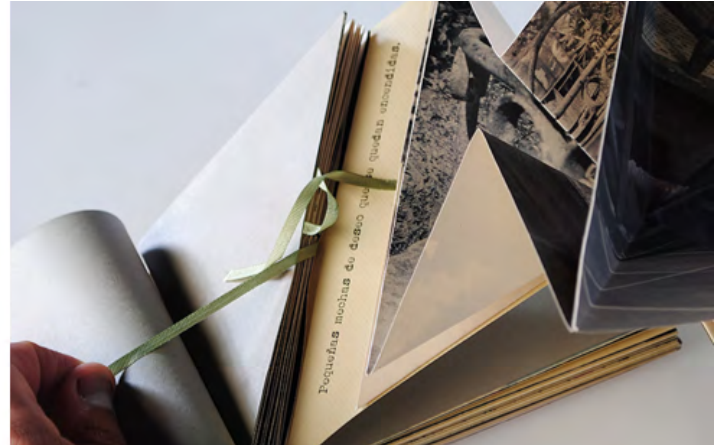
Figuras 3 y 4. Libro-arte Éxodo refleja la añoranza por el lugar de origen, de la familia y los amigos que han quedado atrás y la desubicación y falta de sentido de pertenencia a las nuevas condiciones de vida en la gran ciudad.