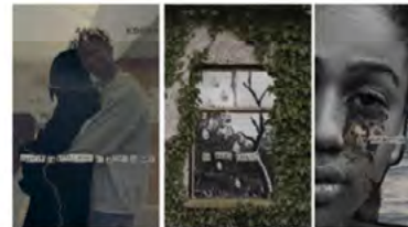
Figura 10. “Ausencia y soledad nace de uno de estos sentimientos y situaciones que personalmente viví durante el encierro y que detonó en un rompimiento”. Texto descriptivo de la problemática y bocetos para la elaboración del libro-arte sobre aislamiento y soledad.