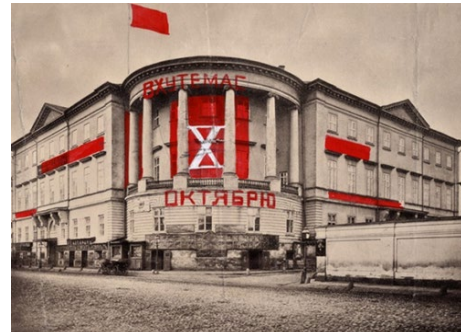
cultura y Arquitectura. VKHUTEMAS, decorado para el aniversario 10 de la Revolución de Octubre por el arquitecto A. Vesnin, profesor de VKHUTEMAS. Moscú, 1927. Imagen de dominio público.