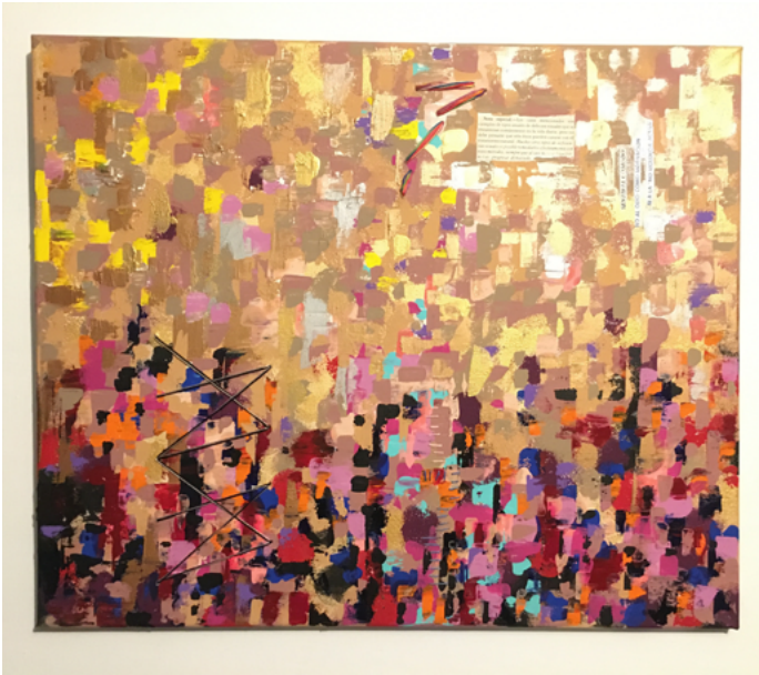
Imagen 3. Obra terminada Disolución , Velázquez (2020)