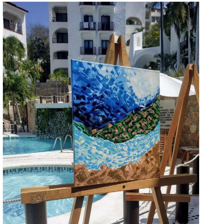
Imagen 6. Obra terminada , Exposición Huatulco, Oaxaca. Velázquez (2020)