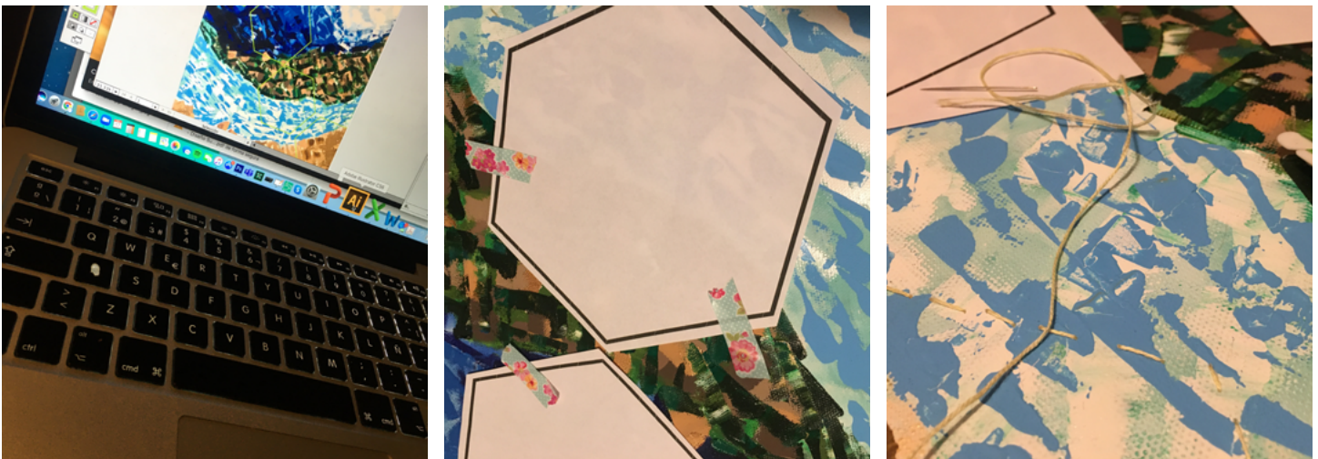
Imagen 4. Proceso de diseño, A. Velázquez (2020)