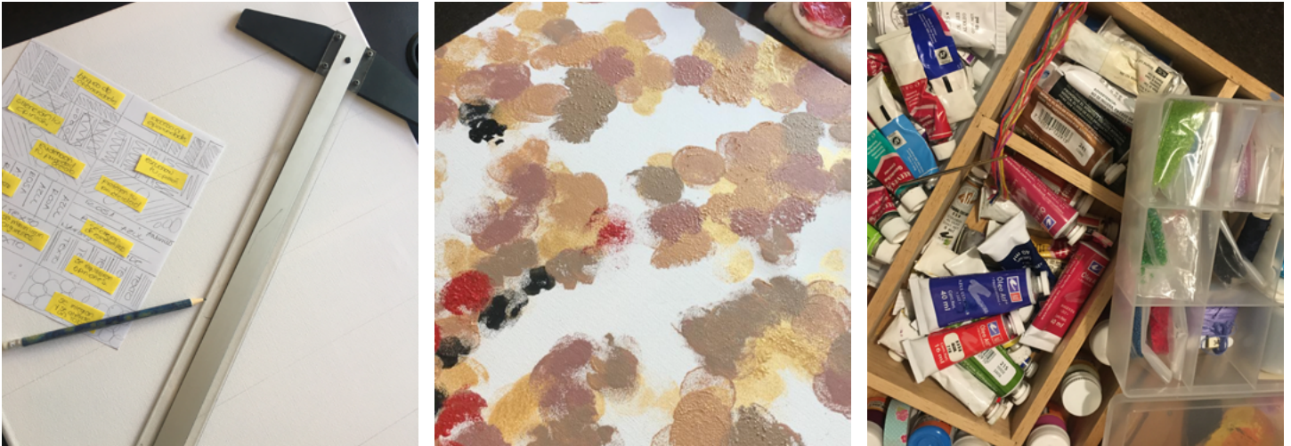
Imagen 1. Proceso de diseño, A. Velázquez (2020)