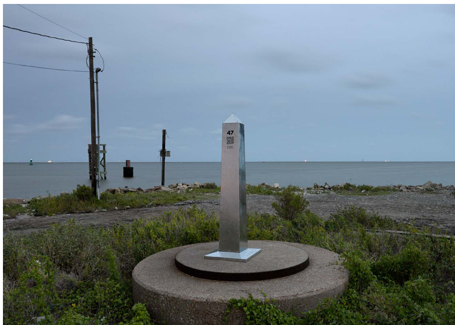
Imagen 9. Última mojonera (ruinas de un antiguo artillero). Fotografía de David Taylor

©Marcos Ramírez ERRE y David Taylor. Cortesía de los artistas