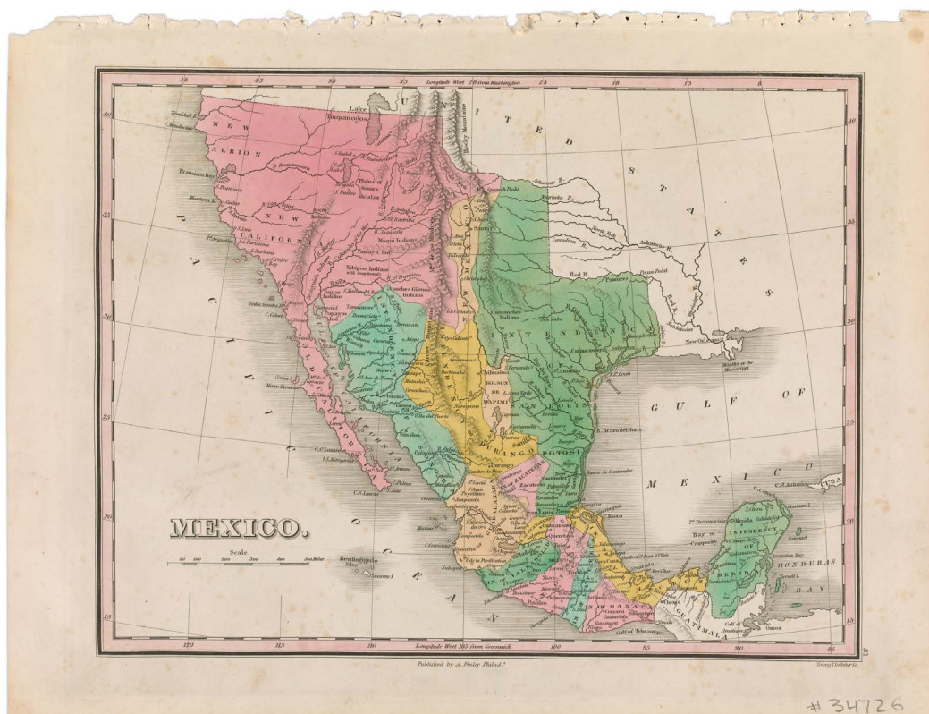
Imagen 1. Mapa antiguo de México ©Marcos Ramírez ERRE y David Taylor. Cortesía de los artistas

...gradualmente expulsaron a los tejanos (tejanos nativos de origen mexicano) de sus tierras, cometiendo todo tipo de atrocidades contra ellos. Su invasión ilegal obligó a México a entrar en guerra para conservar su territorio de Texas. La batalla de El Álamo, en la que los mexicanos derrotaron a los blancos, se convirtió, para estos, en un símbolo de la cobardía y el carácter malvado de los mexicanos. Se convirtió en un símbolo que legitimó la apropiación imperialista blanca, y sigue siéndolo. Con la captura del general Santa Anna en 1836, Texas se convirtió en una republic . Los tejanos perdieron su tierra y, de la noche a la mañana, se convirtieron en extranjeros. (Anzaldúa, 2012, p.46)