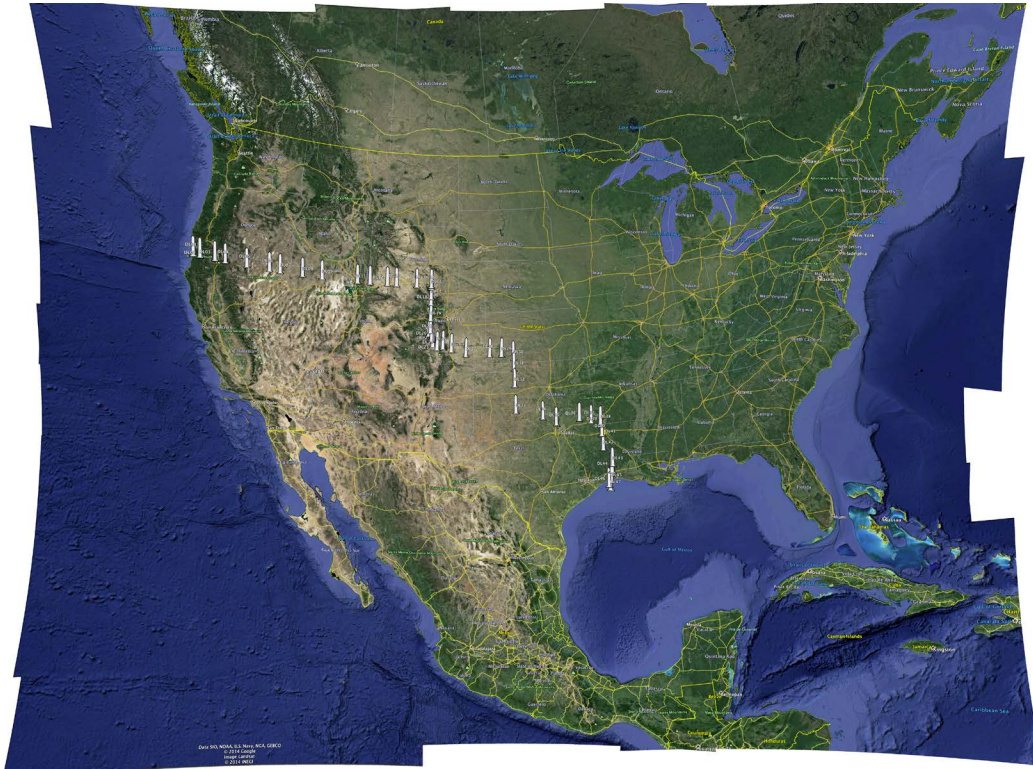
Imagen 2. Ubicación de las 47 mojoneras