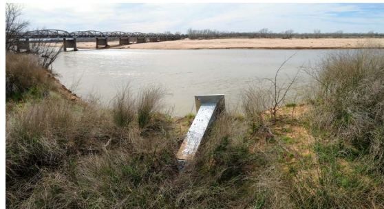
Imagen 3, 4 y 5. Mojoneras y trayecto. Fotografías de David Taylor ©Marcos Ramírez ERRE y David Taylor. Cortesía de los artistas