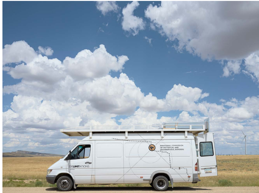
Imagen 8. Van-camper del proyecto DeLIMITations. Fotografía de David Taylor ©Marcos Ramírez ERRE y David Taylor. Cortesía de los artistas

Esta obra reflexiona en torno a las fronteras como hechos arbitrarios, resultado de engranajes políticos que construyen–destruyen-reconstruyen líneas divisorias inicuas, disputas por terrenos que de la noche a la mañana convirtieron en ilegales a personas que solían transitar por la región como un hecho derivado de sus usos y costumbres. La Oficina de Proyectos Culturales define así dicha instalación: