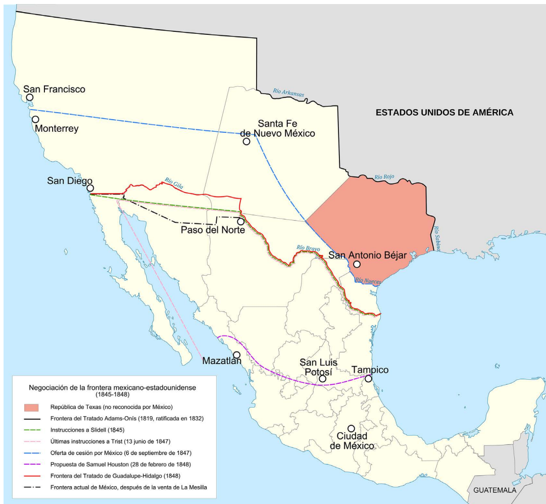
Imagen 7. Reproducido de Negociación de la frontera México-EUA [Imagen] por Yavidaxiu, R. Sodro Cerdeño, M.J. Sierra Moncayo, 2010. Wikipedia ( https://commons.wikimedia.org/w/index.php?curid=16055417 ). CC BY-SA 3.0

Ambos artistas reconstruyeron la división como arqueólogos que desentrañan los vestigios de la población que habitó esos espacios antes de la partición de sus tierras. Para conseguir esa reconstrucción, se valieron de mapas y documentos de la época. Desde esa óptica, la intervención cumplió múltiples roles: fungió como revisión, exploración, documentación y homenaje de un pasado borrado en varios sentidos. Su trabajo-viaje fue documentado por José Inerzia, quien los acompañó en la caravana en la que se movieron por esa añeja línea fronteriza. La travesía de ERRE y Taylor partió de la pregunta: “ what would Mexico and the United States look like if that boundary had been fully realized? ” [¿cómo serían México y los Es-