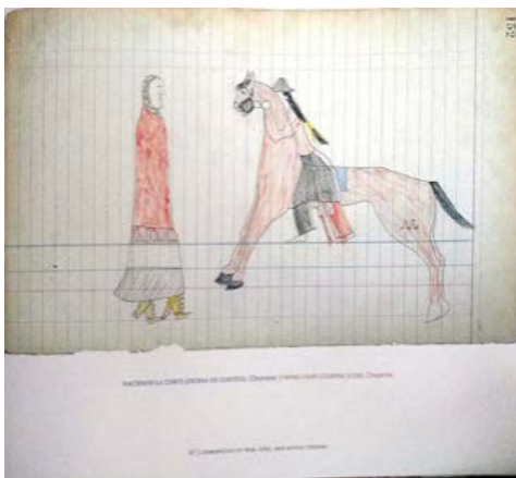
Imagen 4. Haciendo la corte (escena de cortejo). Cheyenne, siglo XIX. Colección José Bedia. (Bedia, 2008, p. 87).

Y es aquí donde el artista intenta introducir un cambio. Big Tree cambia de la mano izquierda y toma el lápiz con la derecha en un último intento de dibujar el caballo en la dirección inversa, de derecha a izquierda, pero el resultado es débil y poco seguro. Incluso el trazo es muy tenue por comparación con los dibujos anteriores. (Bedia, 2008, p.38)