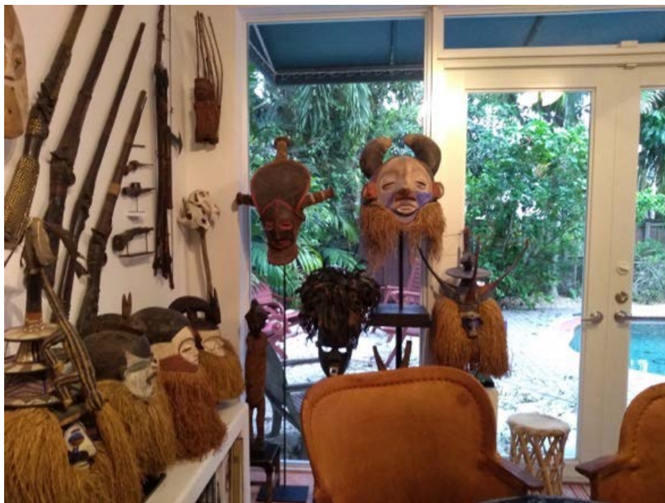
Imagen 2. Colección de Arte Africano, Fotografía, Casa de José Bedia, 2018.

La simetría también se da de forma simbólica en máscaras africanas que pertenecen a grupos donde la línea ancestral se enmarca en el pensamiento bantú. Algunas de estas máscaras, como la que vemos a continuación (imagen 1), señalada con un círculo rojo, perteneciente a la cultura holo, de la región de Angola y de la República Democrática del Congo muestra, preiconográficamente, a través de una mitad inferior azul la definición cosmogónica sobre el mundo de los vivos y los muertos. El azul no es únicamente la línea del horizonte, sino la diferencia entre la noche y el día. La mancha azul sobre el rostro determinado de aparentes mitades es el clásico cosmograma del universo, según los congos y los holo, que coinciden en esta herencia ancestral. Esta línea horizontal o el horizonte del agua o del amor es Kalunga. El mundo de los vivos está arriba y el de los muertos abajo. En este caso, la representación iconológica infiere que cuando el sol da la vuelta es de noche en el mundo de los muertos y viceversa, según quiera verse. El movimiento del sol determina la lectura, el mapa de la imagen.