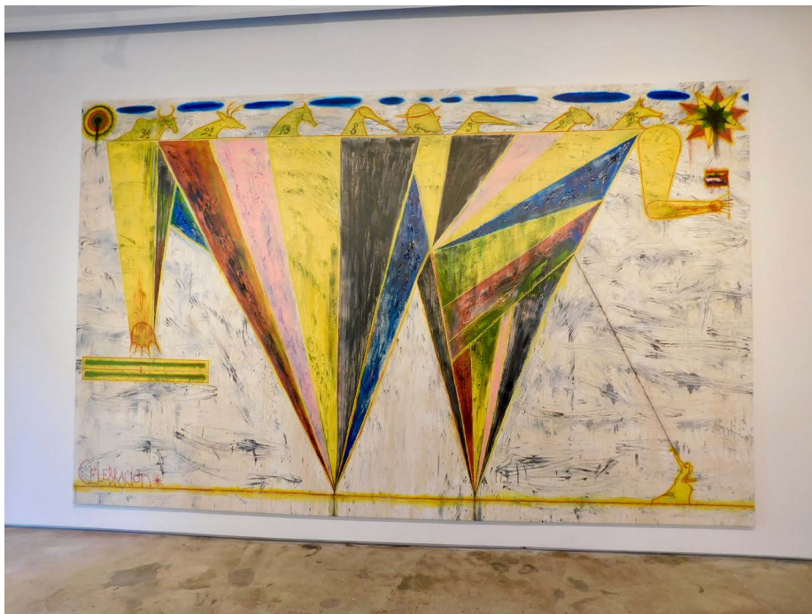
Imagen. Anexo A.

• Bedia agrega a la bandera como repertorio icónico y arquetípico de una identidad o nacionalidad nueva. Es decir, banderas que no pertenecen a ningún país. ( Revisar imagen A )