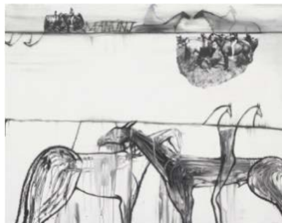
Imagen 5. Maminj (lokoda por “robar una esposa”), crayón, temple, acrílico y papel impreso collage sobre papel. 38”x49”, José Bedia, 1997. Colección Particular.