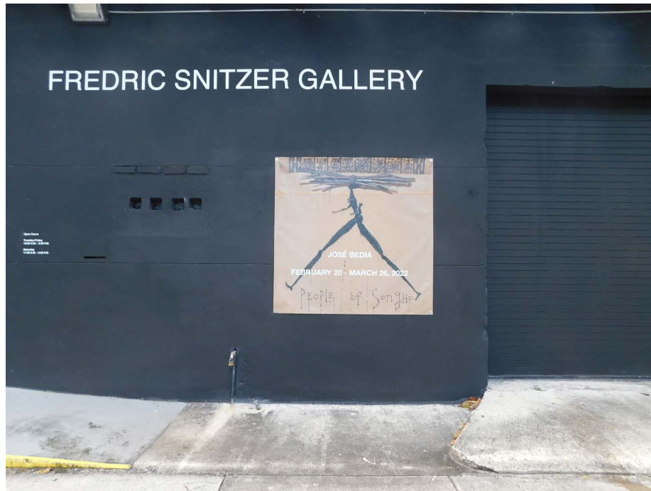
Imagen 1. Fotografía tomada por una servidora (María Teresa Acosta Carmentate) el día del opening de la exposición de José Bedia People of Songho . 20 de febrero del 2022.