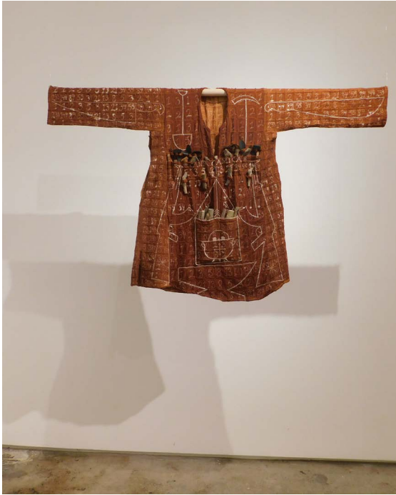
Imagen. Anexo B.