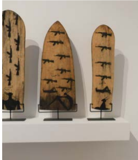
Imagen. Anexo C.